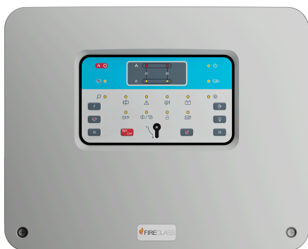
Figuur 2: FireClass Essential-centrale voor 4 zones